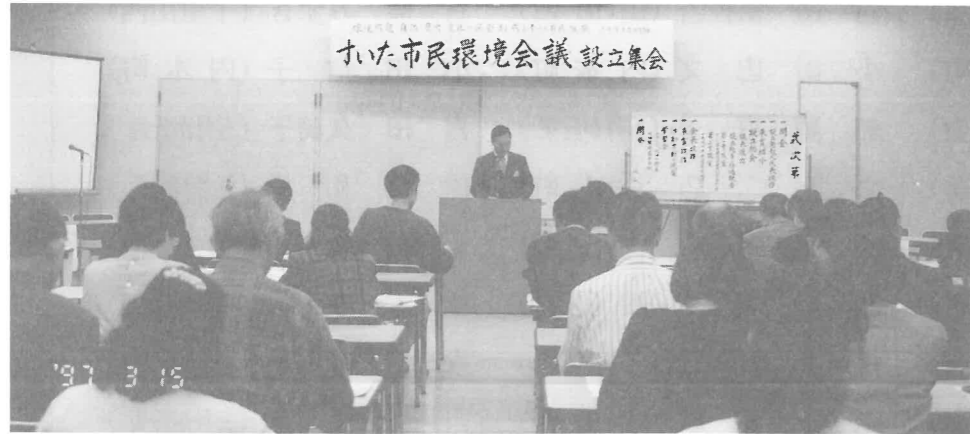
'97. 3. 15 すいた市民環境会議設立集会