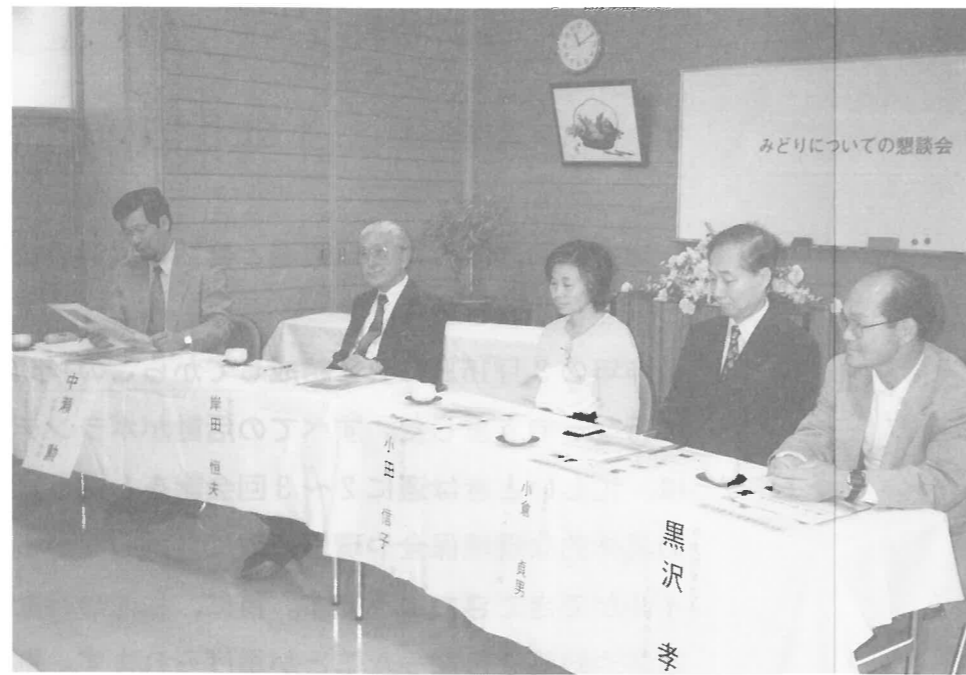
'97. 10. 18・19 大阪府緑化フェア—パネリスト