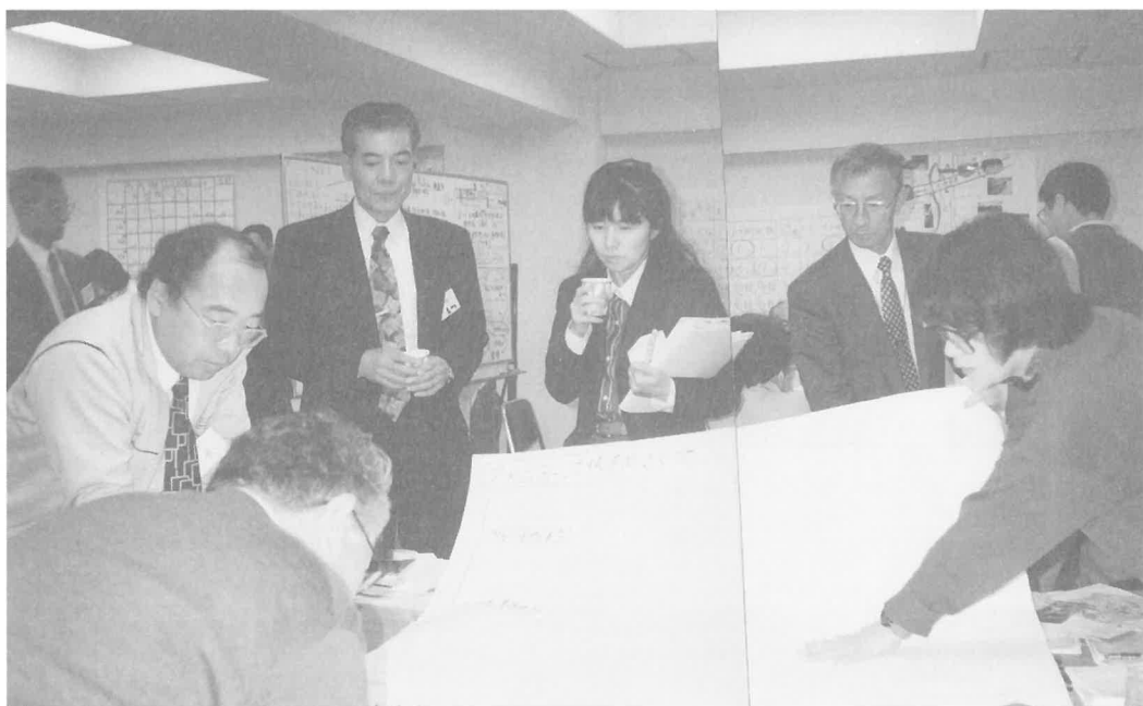
'97. 11. 30・31 第11回環境保全研究会（主催:環境庁、地域交流センター） ワークショップ「街の快適な公共空間づくり」