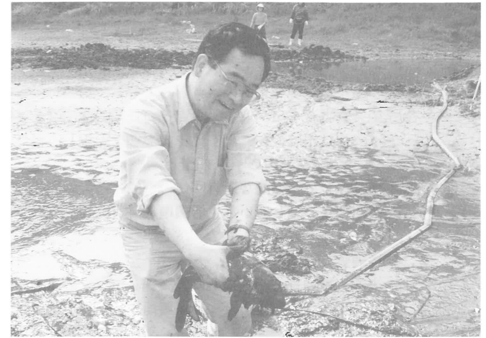
'98. 3. 28 垂水上池公園の生き物救出作戦