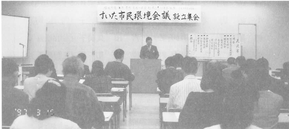
'97. 3. 15 すいた市民環境会議設立集会