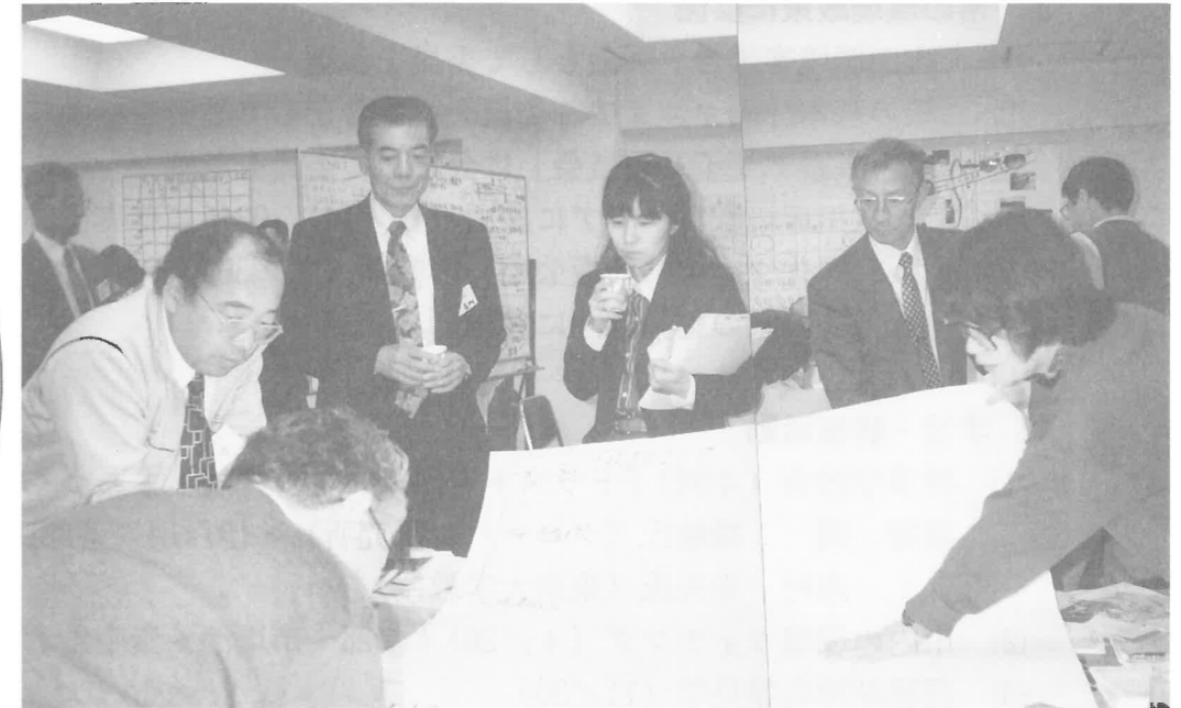
'97. 11. 30・31 第11回環境保全研究会（主催：環境庁、地域交流センター） ワークショップ「街の快適な公共空間づくり」