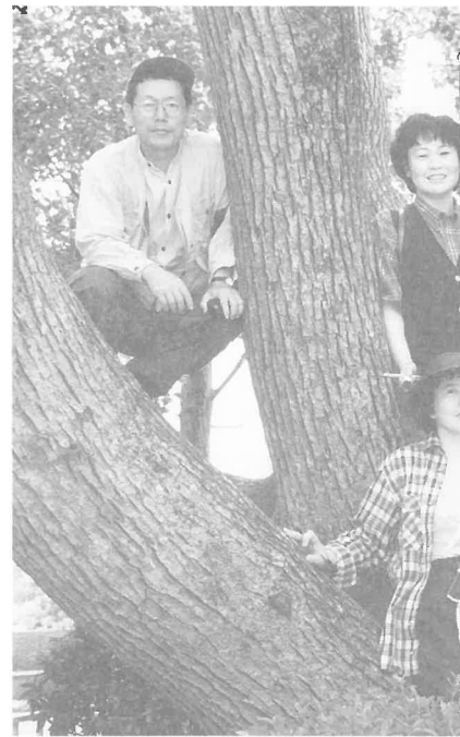
'97. 8 ~ 9