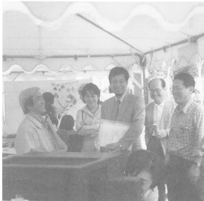
すいた市民環境会議テント 姫路工業大学・中瀬勲教授と談笑