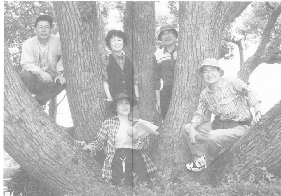
'97. 8~9 古木・大木調査行動隊